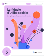
3 La fiducie d'utilité sociale : une option pour les partenariats de données