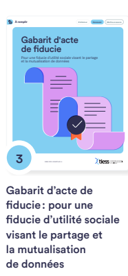
3 Gabarit d'acte de fiducie : pour une fiducie d'utilité sociale visant le partage et la mutualisation de données