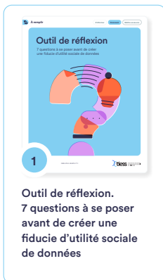
1 Outil de réflexion. 7 questions à se poser avant de créer une fiducie d'utilité sociale de données

Des outils concrets pour guider la création d'une fiducie d'utilité sociale de données ou d'une fiducie d'utilité sociale