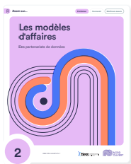
2 Les modèles d'affaires des partenariats de données