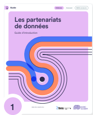
1 Les partenariats de données : guide d'introduction

Des documents à lire, selon vos besoins, à l'étape d'idéation d'un projet