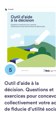
5 Outil d'aide à la décision. Questions et exercices pour concevoir collectivement votre acte de fiducie d'utilité sociale