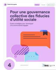
4 Pour une gouvernance collective des fiducies d'utilité sociale : quatre stratégies pour développer une communauté engagée