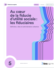
5 Au cœur de la fiducie d'utilité sociale : les fiduciaires. Définition, rôles et administration collective