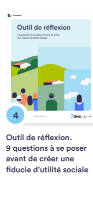
4 Outil de réflexion. 9 questions à se poser avant de créer une fiducie d'utilité sociale