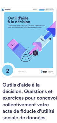
2 Outils d'aide à la décision. Questions et exercices pour concevoir collectivement votre acte de fiducie d'utilité sociale de données